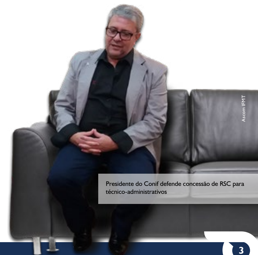
Presidente do Conif defende concessão de RSC para técnico-administrativos

Mais uma vez, um orçamento adequado. Também a contratação de professores e técnico-administrativos, novas políticas de valorização dos servidores, incluindo a concessão do RSC para técnico-administrativos e um programa de mobilidade nacional que contemple estudantes e servidores. A execução de grandes projetos em parceria com outros países também faz parte das nossas prioridades, justamente para que os nossos estudantes levem a Rede Federal para o exterior e tragam novos conhecimentos para o Brasil. p