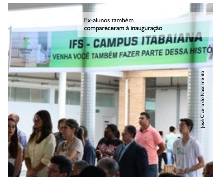
Ex-alunos também compareceram à inauguração