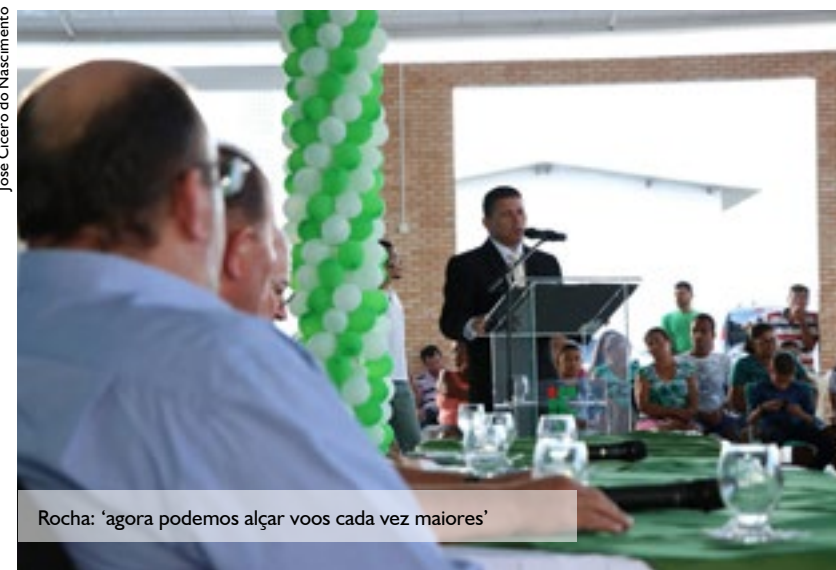
Rocha: ‘agora podemos alçar voos cada vez maiores’