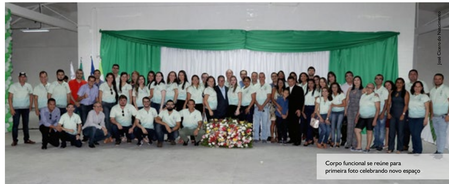
Corpo funcional se reúne para primeira foto celebrando novo espaço