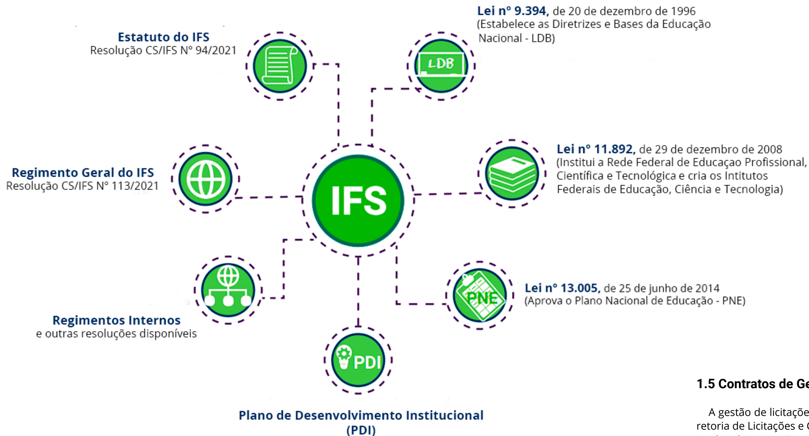
Figura 06 - Principais normas direcionadas a atuação do IFS.