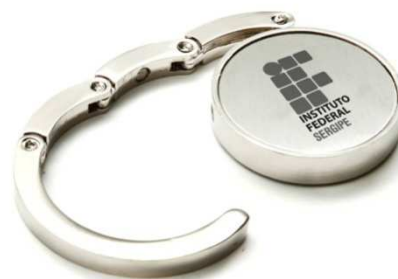
MODELO ITEM 2