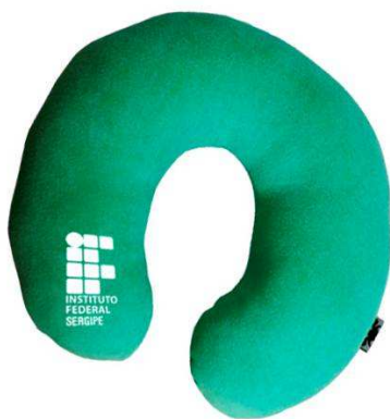
MODELO ITEM 1