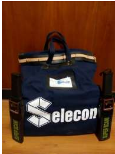
Malotes padronizados e bem identificados