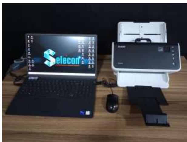
Leitor de cartão resposta