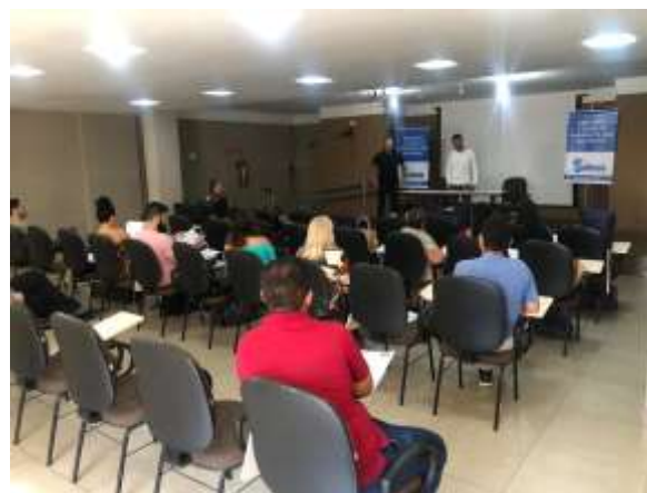
Treinamento da equipe com padrão de aplicação de prova certificado pelos diretores e responsável técnico do Instituto Selecon