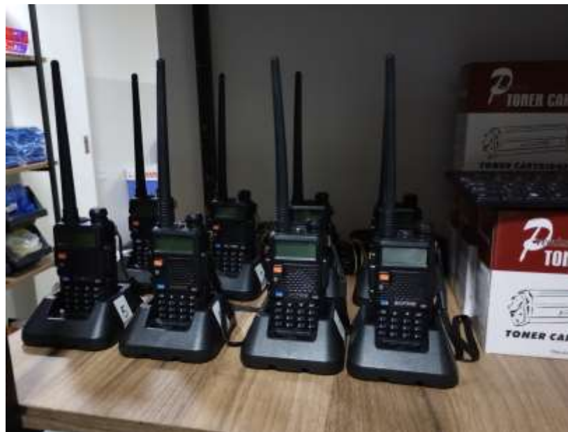
Rádios comunicadores utilizados pelos coordenadores no dia da prova