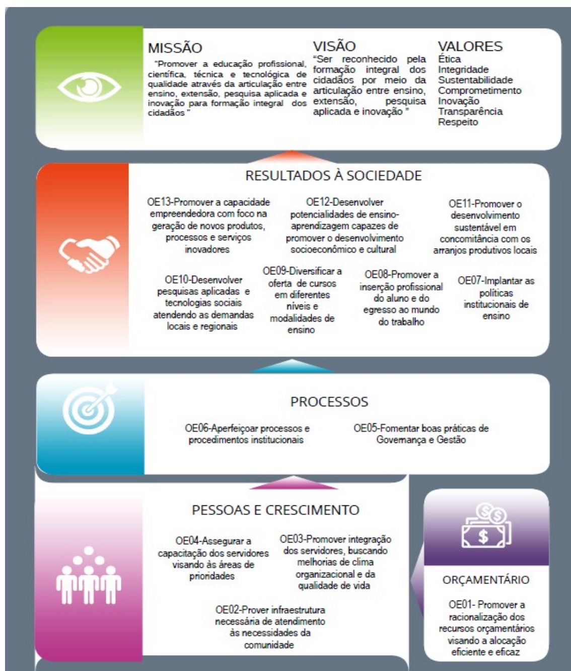
Figura 1 – Mapa estratégico do IFS( 2020-2024)

Mapa Estratégico é uma representação gráfica da estratégia desenvolvida. Ele evidencia os desafios que a organização terá que superar para concretizar sua missão e visão de futuro. A figura 1 apresenta o mapa estratégico do IFS para o período de vigência do PDI (2020-2024), além da missão, visões e valores ele traz os 13 (treze) objetivos estratégicos que deveram nortear as ações desenvolvidas pela instituição.