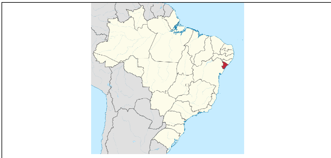
Figura 1. Localização do Estado de Sergipe – Brasil

O Campus IFS São Cristóvão localizado à Rodovia BR-101, S/N, Povoado Quissamã em São Cristóvão – SE, e a obra de pavimentação e estrutura acontecerá em área interna do próprio Campus.