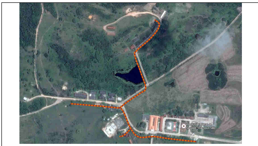
Figura 2. Localização da pavimentação e iluminação por meio de imagem de satélite.