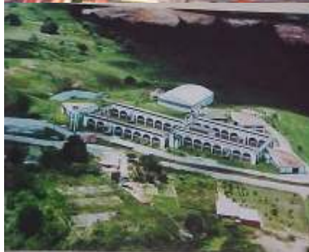
SEDE – ARACAJU